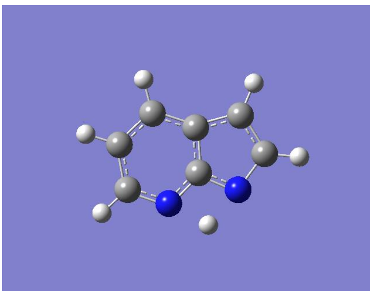
圖三 7-Azaindole 分子異構化的基態 TS 結構

Tautomer 較 normal form 能量高了 12.5 kcal/mol，而從 normal form 出發的能量障礙為 65.5 kcal/mol。因此質子轉移反應幾乎是不可能在此電子基態發生。